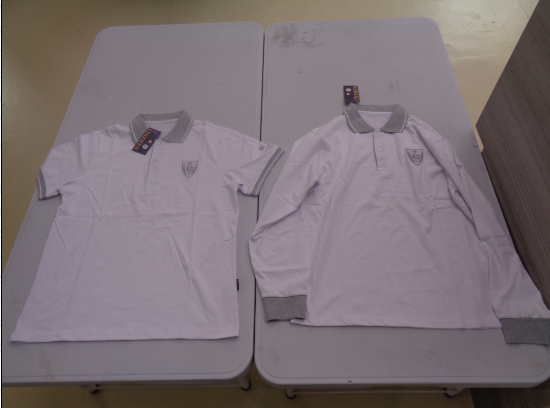
白色拼灰色短/长袖T恤